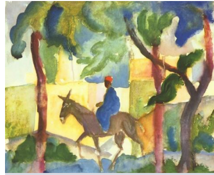
August Macke, 1914