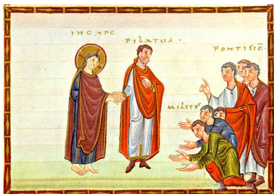
Codex Egberti (980-993, Reichenau)

De vraag naar het koningschap is het eerste en voornaamste wat Pilatus wil weten. Pilatus is opzichter over Judea, een belangrijke provincie van het Romeinse Rijk in die jaren en in die hoedanigheid moet hij de openbare orde handhaven. Dat verklaart waarom zijn allereerste vraag is: 'Bent u de koning der Joden?' Hij wil weten wat Jezus' intenties zijn, preciezer gezegd: wat zijn politieke intenties zijn. Hij zou een rivaal kunnen zijn die de publieke orde wil verstoren. Iemand die, je weet maar nooit, de provincie Judea voor de Joden zou willen terugvorderen.